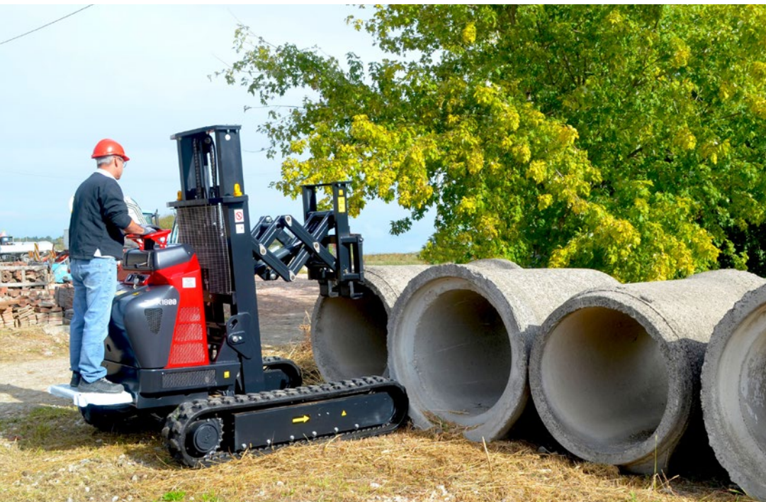
▼ Transport de conduites en béton circulaires pour réseaux d'eau et d'égout.