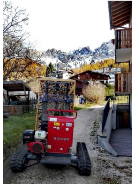
2) SILVANO CALCHERA, PROV. BL