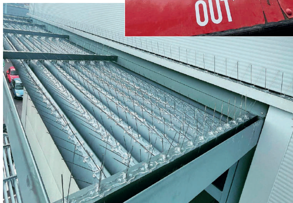
I dissuasori per volatili posizionati grazie alla Lightlift 17.75 MK2

azienda a conduzione familiare specializzata nell'uso delle piattaforme aeree, soprattutto cingolate, utilizzate in ambito civile, industriale, o commerciale. La società mette a disposizione del mercato un'interessante gamma di piattaforme noleggiabili con o senza operatore. Inutile dire come le piattaforme aeree Hinowa siano tra le punte di diamante dell'intera flotta del noleggiatore britannico.